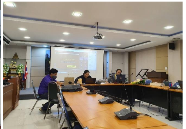
ด้านหลัง